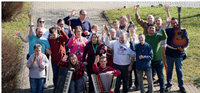
WEFA-Chor der Diakonie Sonneberg

Staatliches Gymnasium Hermann Pistor, Dammstraße 50, 96515 Sonneberg St. Aegidienkirche, Kirchwallstraße 15, 96515 Sonneberg