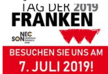
Bild: TdF 2019