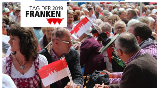
"Gemeinsam, fränkisch, stark!" lautet das Motto zum Tag der Franken 2019. (Logo: Nicole Fleischer/Bezirk Oberfranken)

Facebook Google+ Twitter Xing E-Mail Seite ausdrucken Print Current Page