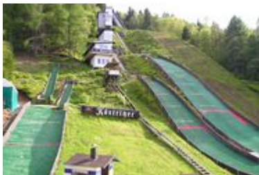
Bild: Marktiegelschanze Lauscha