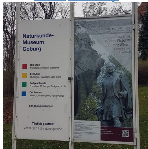
Bild: Sonderausstellung im Naturkundemuseum Coburg

Facebook Google+ Twitter Xing E-Mail Seite ausdrucken Print Current Page